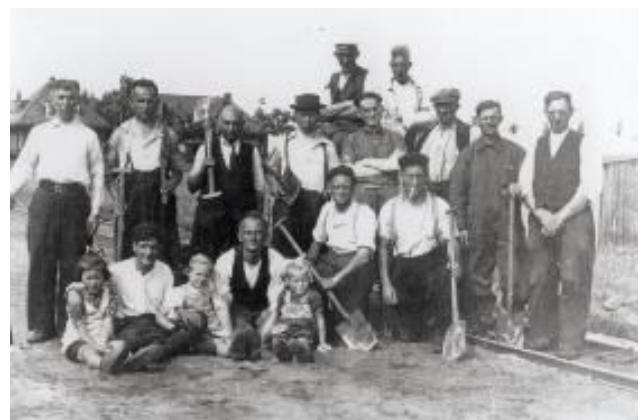
Joodse arbeiders aan het werk in kamp De Beetse