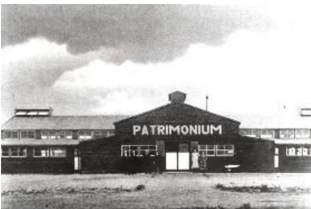
Kamp De Beetse, gelegen bij Sellingerbeetse in het Zuid-Oost Groningse Westerwolde.