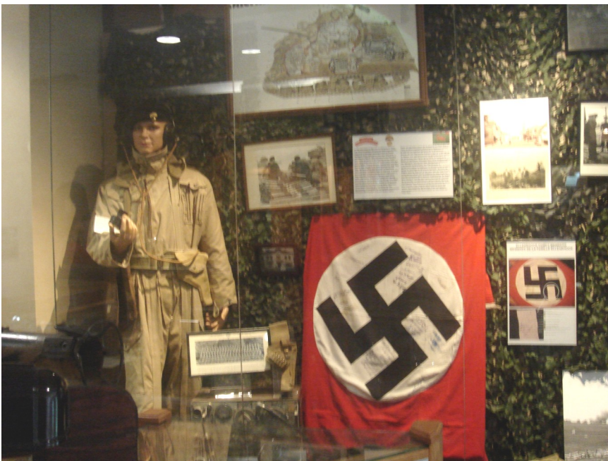
Vitrine in het museum van de Canadian Grenadier Guards in Montreal. Centraal de vlag met 26 Canadese en 6 Nederlandse handtekeningen.

De Duitsers zijn op 3 april in alle haast vertrokken onder achterlating van allerlei spullen. Op enig moment vinden de Canadezen een Duitse vlag met hakenkruis; hét symbool van de overheersing en alle ondergane ellende. In de euforie van de overwinning plaatsen een aantal Canadese soldaten en Bornenaren hun handtekeningen op de vlag. En zo wordt deze vlag een symbool van overwinning op de vijand. In september vertrekken de Canadezen. De vlag wordt door de Canadese ondertekenaars meegevoerd naar Canada en belandt uiteindelijk, via de weduwe van één van de ondertekenaars, in het legermuseum.