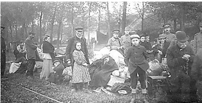
De meeste Belgische vluchtelingen kwamen zonder persoonlijke bezittingen naar Nederland. Een enkeling had wat extra kleding bij zich. Hierboven een rij wachtenden bij de douane van de Belgisch-Nederlandse grens.

De vluchtelingenstroom is ook bekend in Amerika. Verschillende staten zijn hier bezig het land te ontwikkelen. Zo is er de "Southern Settlement and Development Organisation" in Baltimore die gegadigden zoekt voor ontwikkeling van land- en tuinbouw en doen omstreeks half januari 1915 een beroep op Belgische vluchtelingen in Nederland om zich in Amerika te vestigen. Het aanbod is aantrekkelijk: de overtocht wordt betaald, een compleet ingerichte 4- of 5-kamerwoning met 40 acres grond (1 acre is ca. 0,5 ha=500 m 2 ) is ter beschikking, ook etenswaren voor 6 maanden, een paard, een koe, twee varkens, 12 kippen, landbouwwerktuigen en zuiver drinkwater. Een station voor afvoer van producten ligt binnen 3 miles (ca. 5,5 km) en een school en een RK-kerk is aanwezig. Het eerste jaar behoeft geen terugbetaling te worden gedaan, de volgende jaren wordt 1/20 deel per jaar afgelost wat neer komt op ca. 100-150 dollar per jaar. In de oorlogsjaren 1915-