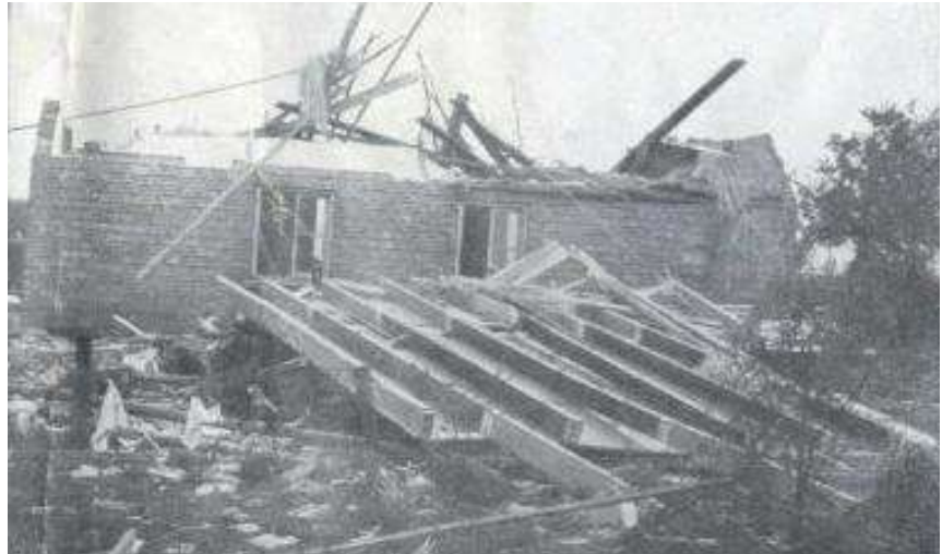
Een zwaar gehavende woning in Hengevelde.

In de weken en maanden die volgen vindt herbouw plaats van de beschadigde woningen en boerderijen. Dankzij alle krachtsinspanningen komen de getroffen en er weer bovenop. Het gewone leven herneemt zijn gang en spoedig is de cycloon alleen nog herinnering. Maar wel een herinnering die de getuigen van de natuurramp een leven lang bij zal blijven.