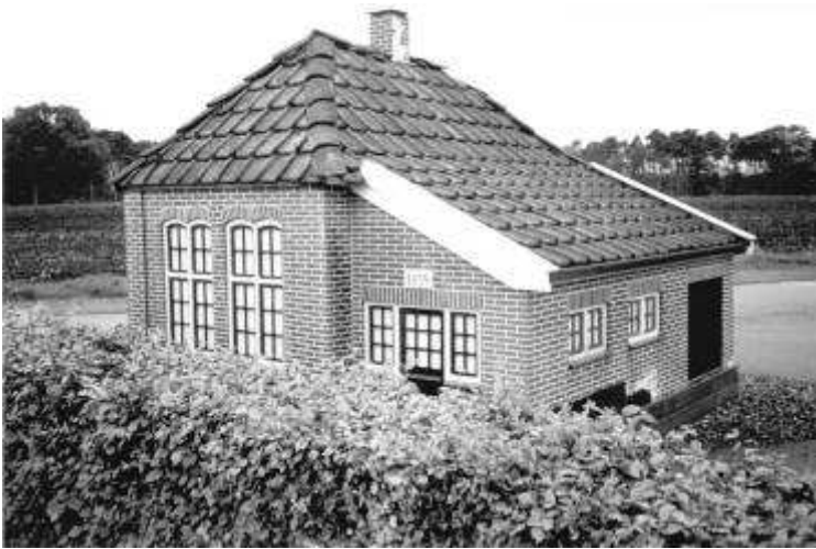
Schaalmodel van het schooltje dat in 1839 in Azelo werd gebouwd. Foto Hans Gloerich (ca. 1990).

Op de markevergadering van 14-08-1810 wordt de bouw van een nieuwe school goedgekeurd voor een bedrag van 1514 gulden en 2 stuivers. Het bedrag wordt verkregen door het veilen van markehout dat werd gekapt op de Loofbree, achter Dubbelink. De nieuwe school werd gebouwd op een laaggelegen stuk grond tussen de boerderijen van B. Vos en Wensink (Peper) in Azelo 9 . Maar ook dit schooltje voldeed op den duur niet meer. In 1837 zijn in opdracht van de gemeenteraad bestek en tekeningen gemaakt voor een nieuwe school. Een klein jaar later wordt een krediet van 2400 gulden verleend. De provincie lapt 800 gulden bij en in 1839 is de school gereed. Deze werd gebouwd niet ver van de plaats van de vorige 10 . Rond 1990 is bij de toenmalige school van Azelo een schaalmodel van het schooltje uit 1839 gebouwd.