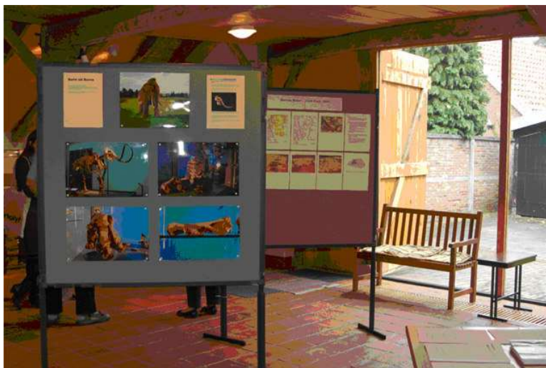
Overzicht van de tentoonstelling in de "Oale Schöp"

Van de overige vondsten uit dit graf waren wel foto's aanwezig, maar de voorwerpen zijn in een dermate slechte staat, dat vervoer c.q. tentoonstellen op dit moment niet mogelijk is. Restauratie volgt binnenkort.