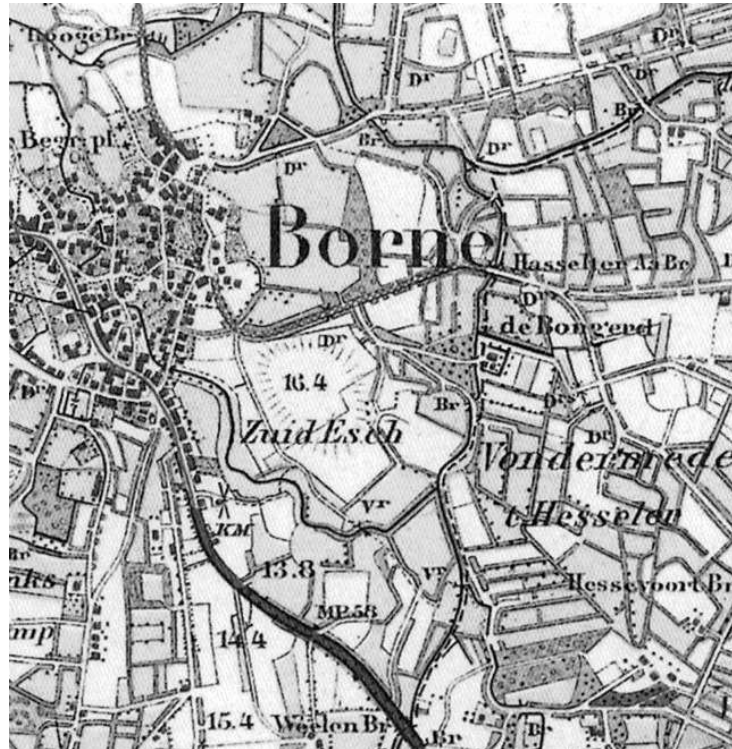
Deel van een kaart uit de Grote historische atlas, deel 3 Oost Nederland. Van zuid naar noord: de Weelebrug, de brug bij de Bongerd en de Hasselter Aa brug

Vóór 1811 heeft er geen brug in deze weg over de beek gelegen. Familieleden uit Hasselo en Zenderen / dorp Borne konden, als ze lopend waren, via de vonder oversteken of op een kar of wagen door de bedding rijden. Kon dit alles niet dan kon de Weelebrug over de Bornse beek 5 worden gebruikt. De grens tussen het gericht Oldenzaal, met de marke Hasselo en het gericht Borne met de marke Zenderen, liep voor een gedeelte door de A-beek. Geschillen hierover hebben zich dan ook vaak voorgedaan.