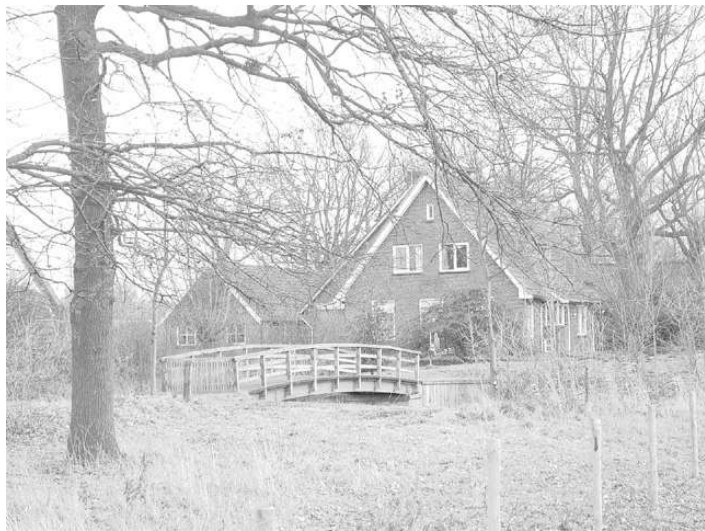
Boerderij en brug bij de Bongerd in 2007

toename van de textielhandel. Ook verzoeken ze Ridderschap en Steden: "Die van Woolde een gratieus support of toeslag te verleenen om de weg tusschen Hengelo en Borne ter oorzaak der reyderijen, fabriquen en handel met veel passages te voorzien van een brug 10 en deze in goede staat te houden". De drost, door Ridderschap en Steden ingefluisterd, komt op 17 oktober 1769 met zijn reactie. Hij zegt de situatie zelf te hebben bekeken en dat wat de Bornsen beweren, dat de postweg die route neemt, in zoverre waar is dat dat de laatste maanden zo is. Hij stelt dat de Bornsen het meeste profijt zullen hebben van een brug over de A en dus ook de kosten moeten betalen. De marke Hasselo zal de Krommebrug, verderop in Hasselo, die gebouwd zal worden, ook moeten betalen.