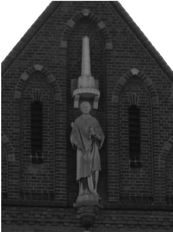
St. Stephanus van de kerk aan de Grotestraat

Hij was de eerste martelaar. Zijn geschiedenis wordt op dramatische wijze weergegeven in de bijbel: Handelingen 6 en 7. Daarin wordt hij beschreven als een man vol van geloof die wonderen verrichtte onder het volk. Maar het verging hem net als zijn grote meester Christus. Hij werd gearresteerd en moest zich voor de joodse raad verdedigen. In een historisch overzicht van de geschiedenis van het joodse volk maakt hij duidelijk dat Christus' komst noodzakelijk was. Zijn steeds kwader wordende toehoorders wast hij onbehoorlijk de oren door niet alleen hen maar ook hun vaders te beschuldigen van moord. Na zijn verdediging heeft hij een hemelse glans op zijn gezicht. Een woedende menigte sleept hem de stad uit waar hij wordt gestenigd en net als Jezus bidt hij tot God dat ze zijn