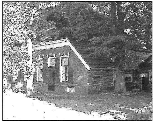
Rijssenseweg 67 te Wierden.

is er op gezet waarbij, in tegenstelling wat normaal gebruikelijk was, de Bentheimer stenen bij dit erf geheel onder de grond terecht kwamen.