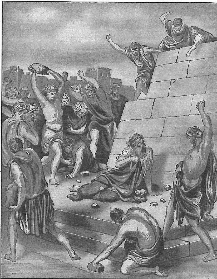
De steniging van de later heilig verklaarde Stephanus, naamgever van de oude kerk.

Het verhaal van deze keer gaat niet over wat er allemaal wèl te zien is in de oude Stephanuskerk, maar over wat uit de kerk is verdwenen. Daarvoor is een goede reden: Op 12 februari 1998 was het n.l. precies 400 jaar geleden dat de altaren uit de kerk moesten verdwijnen. Er waren destijds drie altaren opgesteld en wel voor: 1. Stephanus, 2. Nicolaas en 3. Maria. In deze aflevering willen wij de betekenis van deze drie heiligen voor het gewone kerkvolk van weleer eens nader bekijken.