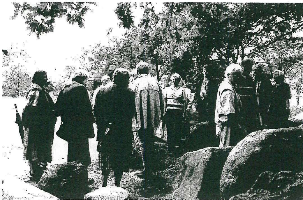
Het bezoek aan de hunebedden.

Vervolgens gingen we naar het enkele km's westelijker gelegen Groß Berßen, waar we na een korte wandeling een paar prachtige hunebedden mochten bekijken.