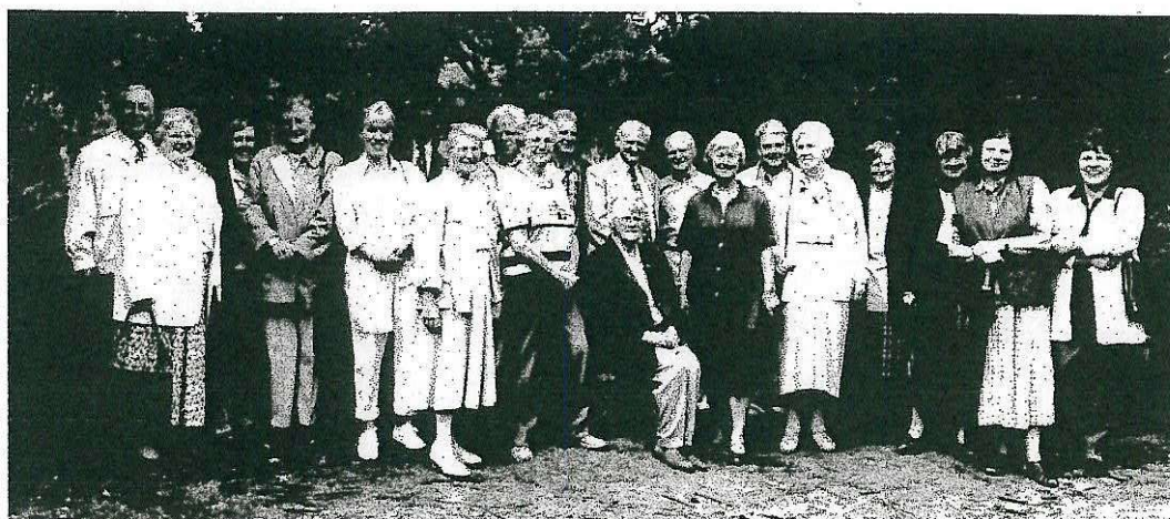
De deelnemers aan deze mooie excursiereis.

Vervolgens gingen we naar het enkele km's westelijker gelegen Groß Berßen, waar we na een korte wandeling een paar prachtige hunebedden mochten bekijken.