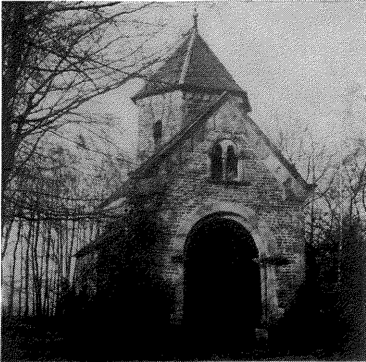
De kapel is gereed...

bedragen binnen van 2 x fl. 25,00 en van fl. 10,00. Het plan was om met dit geld een voorlopige dakbedekking te kopen die later door een leien bedekking vervangen zou worden.