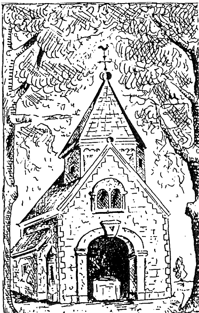
Zo moet de kapel worden.