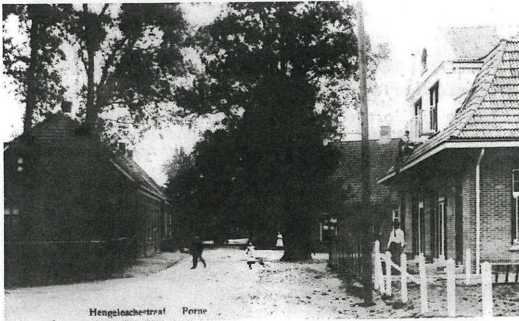
Situatietekening voor de bouw van het dubbele woonhuis aan de Hengeloschestraat d.d. 27 Aug. 1913.

Het betreft de dubbele woning thans genummerd Grotestraat 129/Aanslagsweg 53. Op de hierbij afgedrukte ansichtkaart van de Hengeloschestraat (richting Hengelo) ziet U rechts het bewuste pand dat, zoals U zelf kunt zien, in de laatste fase van de bouw verkeert. Verderop rechts het café van Höften Gaike, op de plaats waar nu een plantsoentje is op de hoek van de Aanslagsweg, Morseltdijk en de huidige Grotestraat, zoals de toenmalige Hengeloschestraat nu heet.